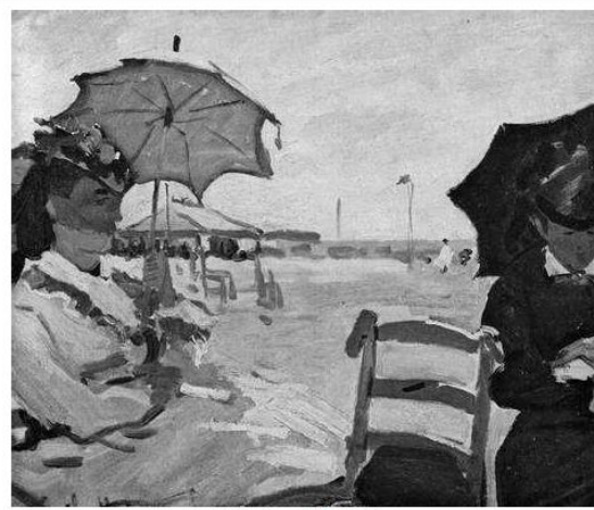
La plage à Trouville Claude Monet