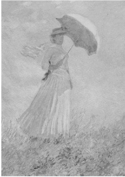
Femme à l'ombrelle, Claude Monet