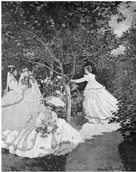
Femmes au jardin à Ville-d'Avray, Claude Monet