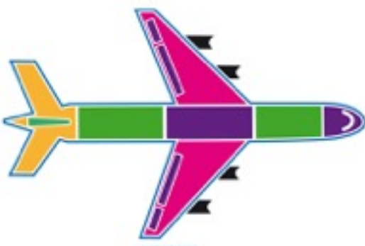
L'airbus 380 : un avion européen

Ils sont le plus souvent accompagnés d'un guide de lecture, texte destiné à aider le lecteur dans l'exploration de l'image en relief.