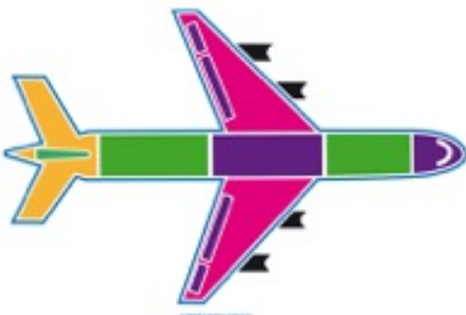
L'airbus 380 : un avion européen

Ils sont le plus souvent accompagnés d'un guide de lecture, texte destiné à aider le lecteur dans l'exploration de l'image en relief.