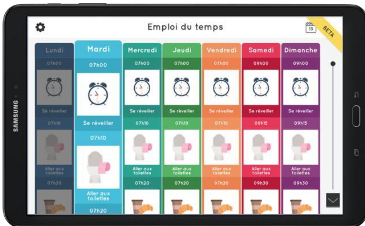
Vue hebdomadaire de l'emploi du temps

AGENDA est une application pour tablettes numériques Android et Ipad qui permet de construire un emploi du temps visuel et personnalisé utilisable en mobilité. Elle permet aux élèves avec troubles du spectre autistique ou avec des difficultés à lire l'heure d'améliorer leur perception du temps, leur capacité de planification et d'être sécurisés en ce qui concerne la gestion de leur emploi du temps.